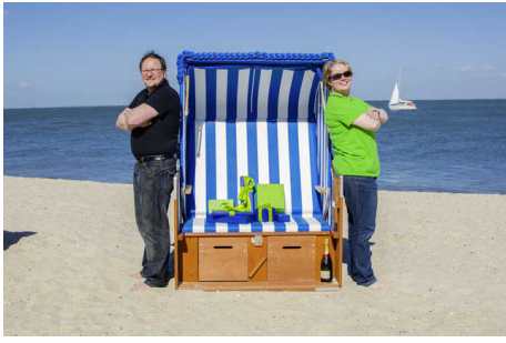
Objekt ID: 76207